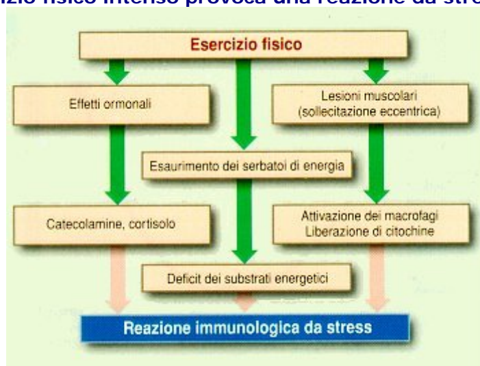
FIG. 1 L'esercizio fisico intenso provoca una reazione da stress immunitario

Questa situazione può essere riconoscibile anche sulla base di un leggero aumento della creatinichinasi. Il correlato patologico a livello muscolare consiste tra gli altri in una distruzione delle "strutture Z" (1).