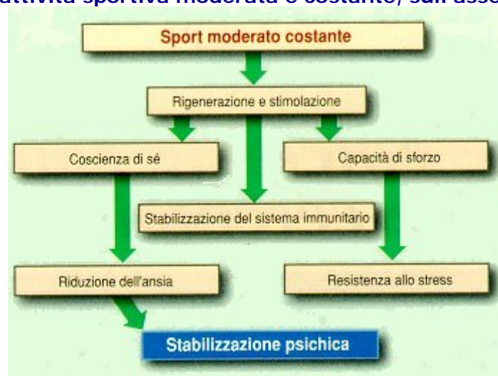
FIG. 3 Effetti dell'attività sportiva moderata e costante, sull'assetto fisico e psichico

Per lo sport - anche per quello amatoriale - vale il concetto, già espresso da Paracelso: "è la dose che rende pericoloso un veleno".