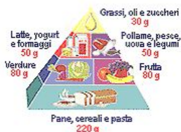
Piramide della corretta alimentazione giornaliera

In generale, la composizione della dieta è raccomandata in base al modello cosiddetto della piramide alimentare :